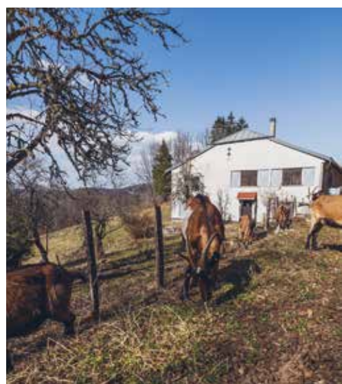
LA BÂTISSE ET SON TROUPEAU DE CHÈVRES Commune des Hauts de Bienne

Le Conseil Municipal a donc validé la promesse de vente, en prenant soin d'ajouter une close pour garantir la mise en œuvre de ce projet d'agrotourisme. L'acquisition et le lancement des travaux devraient avancer d'ici la fin de l'année 2022. Encore un beau projet en cours à Morez, qui va apporter de l'activité sur notre vallée.