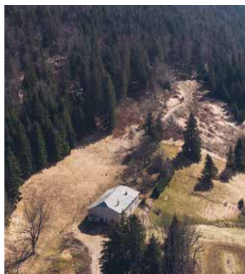
« FERME DE LA MONETTE » VUE DU CIEL Commune des Hauts de Bienne