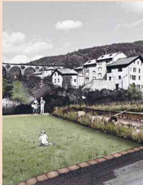
ESPACE DE JEUX D'ENFANTS

Les principaux aménagements consisteront à abaisser le Quai Jobez à proximité de la Place Jean Jaurès pour donner accès à la rivière, créer un parc dans le secteur Lamy-Jeune, renaturer la Bienne et stabiliser les murs des berges. Du mobilier urbain, de la signalisation et des revêtements de sol viendront compléter les travaux.