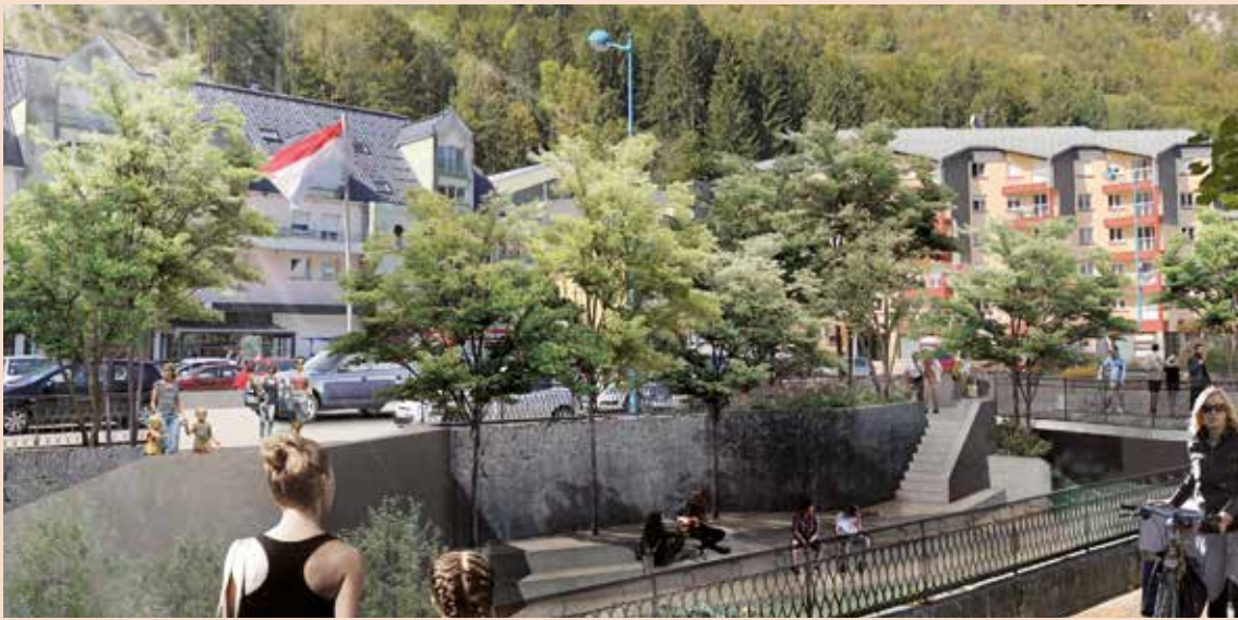
QUAI JOBEZ - SECTEUR CENTRE