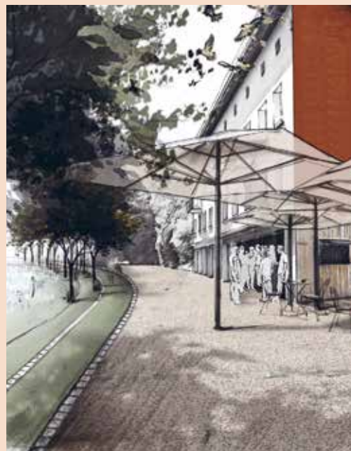
SECTEUR PROMENADE - RUE PIERRE MOREL

L'Échappée Bienne contribuera à préserver l'eau, apporter de la fraîcheur et réduire les déplacements en véhicule à moteur au profit des déplacements doux.